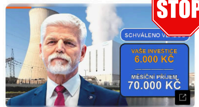
Investiční platforma ČEZ-Group

Podobná videa zneužívají i prezidenta Petra Pavla. Ve falešném projevu nabízí občanům, aby investovali do energetického gigantu ČEZ přes speciální platformu, která je prý pod záštitou státu. Deepfake slibuje zisky z prodeje elektřiny a plynu pro každého.